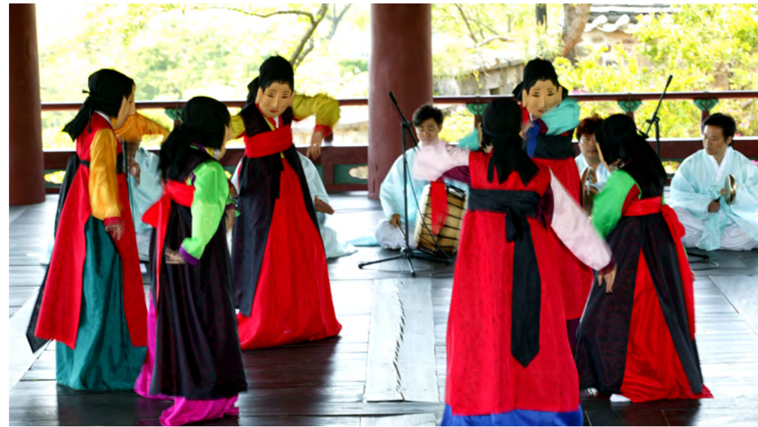
24. 정민채, 앞의 글, 37쪽 참조.