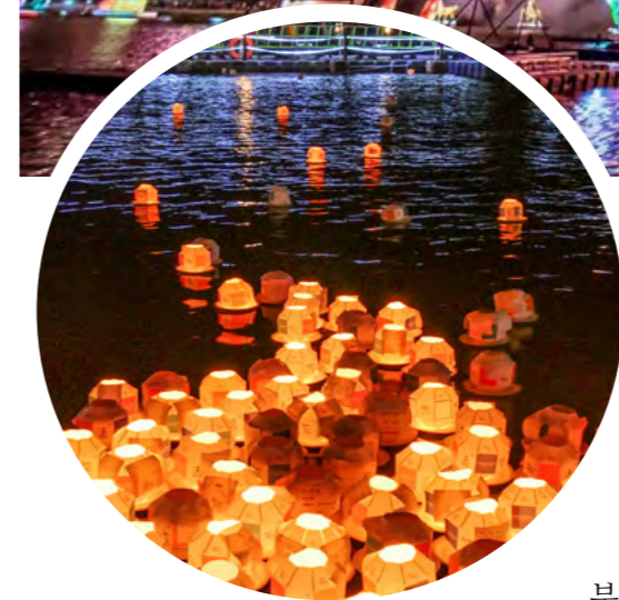
↑ 진주남강유등축제(사진 출처 : https://www.jinju.go.kr ) ← 진주남강유등축제(사진 출처 : https://www.jinju.go.kr )

해방 이후 개천예술제는 진주 지역의 전통예술을 담아내는 주요한 틀로서 역할을 해왔다. 그리고 그 전개 과정에서 또 다른 축제를 길러내는 모판 역할을 하기도 했다. 1955년 제6회 개천예술제에서 유등대회가 생겨났는데, 20 이 유등대회가 발전하여 2000년부터 진주남강유등축제로 독립한 것이다. 진주남강유등축제는 우리나라의 대표적인 야간형 축제이다. 이미 대한민국 대표 축제를 넘어 글로벌 축제에 올라있다고 평가되고 있다. 21 그런데 진주남강유등축제 기간 진주를 찾는 관광객은 280만 명이며, 그 경제적 효과가 1600억에 이른다고 한다. 22 이러한 평가가 사실이라면, 창의도시에서 지향하는 문화산업의 실마리를 여기서 찾을 수 있다. ‘정책 주체와 지역민이 상생 가능한 경제 모델의 틀’을 진주남강유등축제에서 참조할 수 있는 것이다. 관의 지원과 관심으로 만들어진 틀에 민속예술을 중심으로 한 내용이 내실 있게 채워진다면, ‘혁신적인 산업활동’이 그저 이상적인 꿈만은 아닐 듯싶은 것이다.