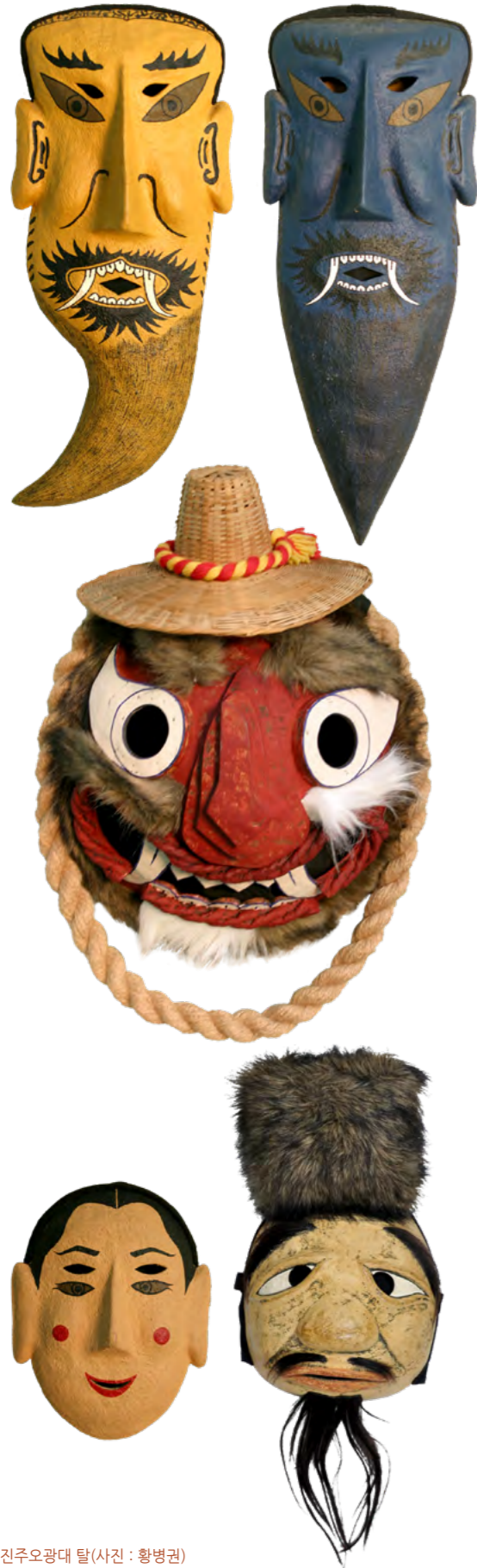
진주오광대 탈

관심의 대상이 되었음을 말하는 것이다. 1929년 정인섭에 의해 이루어진 채록 작업은 우리의 가면극의 기록사에 있어 가장 먼저 이루어진 것이다. 구전과 행위로만 전승되던 민속예술인 가면극이 기록으로 남겨진 최초의 사례라 할 수 있다. 이러한 기록이 있었기 때문에 진주오광대가 온전하게 복원될 수 있었다. 전통예술 혹은 민속예술의 전승과 관련하여 기록의 중요성을 다시 한번 보여주는 사례가 진주오광대를 통해 확인할 수 있는 것이다.