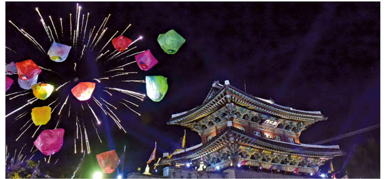
진주남강유등축제 ! 아래 진주삼천포농악