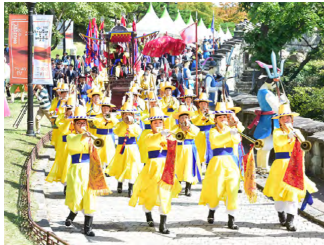
① ② ③ ① ~ ③ 진주개천예술제

진주의 민속예술, 그리고 민속예술과 영향을 주고받은 교방예술의 전승 패턴은 축제화의 모색으로 맺어지고 있음을 앞에서 확인했다. 이러한 축제화는 진주의 특징이라 할 수 있다. 물론 축제화는 해방 이후 우리의 문화 정책이나 흐름에서 비롯되었을 가능성이 크다. 그런데도 진주의 특징이라 할 수 있는 이유는 개천예술제 때문이다. 19 국내에서 개천예술제보다 오래된 지역 축제는 없다. 오랜 전통을 자랑하는 백제문화제가 1955년에 시작되었고, 신라문화제 역시 1962년부터 시작되었다. 이렇게 최초의 근대적 지역 축제를 만들어낸 도시가 진주이다. 그만큼 새로움에 대한 모색과 그 실천성이 두드러졌다.