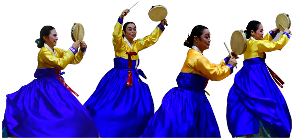
12. 강동욱, 앞의 글. 13. 백재민, 앞의 글, 5쪽.