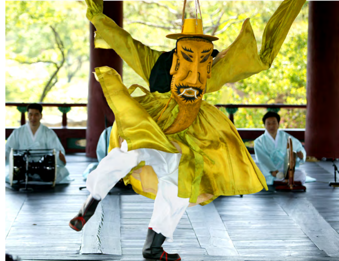
↑ 위 진주오광대(사진 : 유근종) ↓ 아래 진주오광대(사진 : 유근종)

그런데 그 전승과 복원 및 확산의 과정에서 핵심적인 역할을 한 것은 무엇보다도 정현석의 「교방가요(敎坊歌謠)」라는 책이다. 교방가요는 정현석(鄭顯奭: 1817~1899)이 1872년 음력 2월에 편찬한 책으로, 19세기 중·후반 지방 교방의 기녀들이 이습(肄習)하고 연행했던 공연물들에 대한 실상을 알려주는 일종의 ‘교방문화보고서’이다. 16 이 책에서 ‘의암별제가무(義巖別祭歌舞)’라는 관련 기록이 없었으면, 그 복원과 전승에 많은 어려움에 봉착했을 것이라 생각한다. 그 전승 과정에서 단절이 있었음에도 이 기록이 있어 의암별제의 복원이 가능했다. 그리고 복원 이후 진주논개제로의 확장을 통하여 축제로 전화시키고 있다.